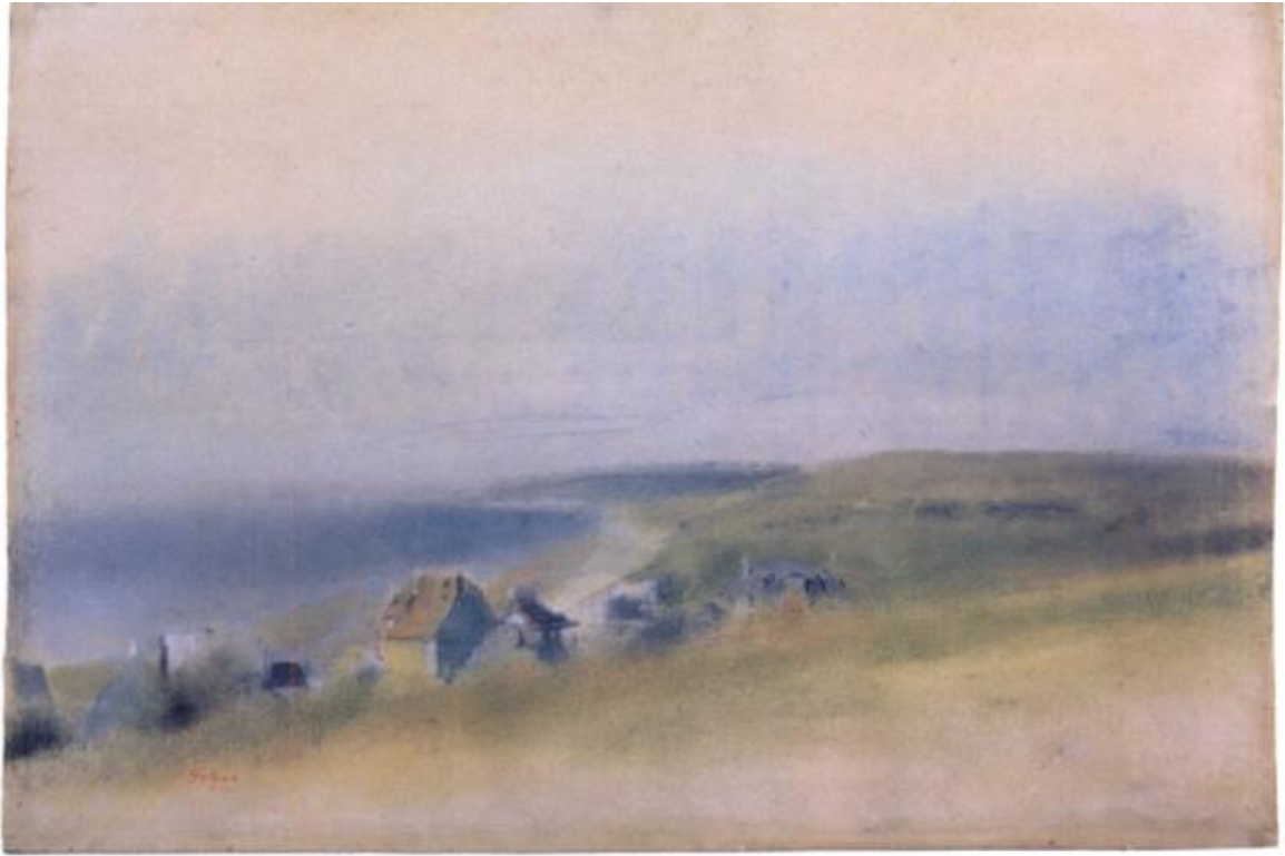
Falaises autour de la Baie. L 252 depuis le haut des falaises vers Villers-sur-Mer