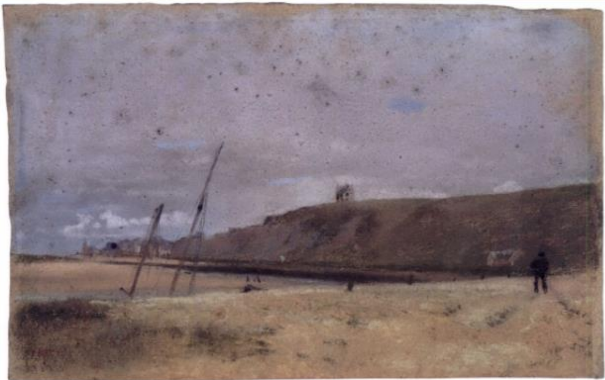
Falaises au bord de la mer L 217 depuis le port de Dives