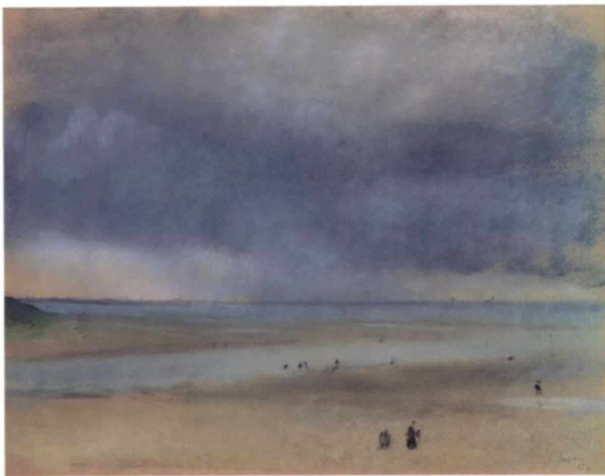
A côté de la mer L 205 collection privée