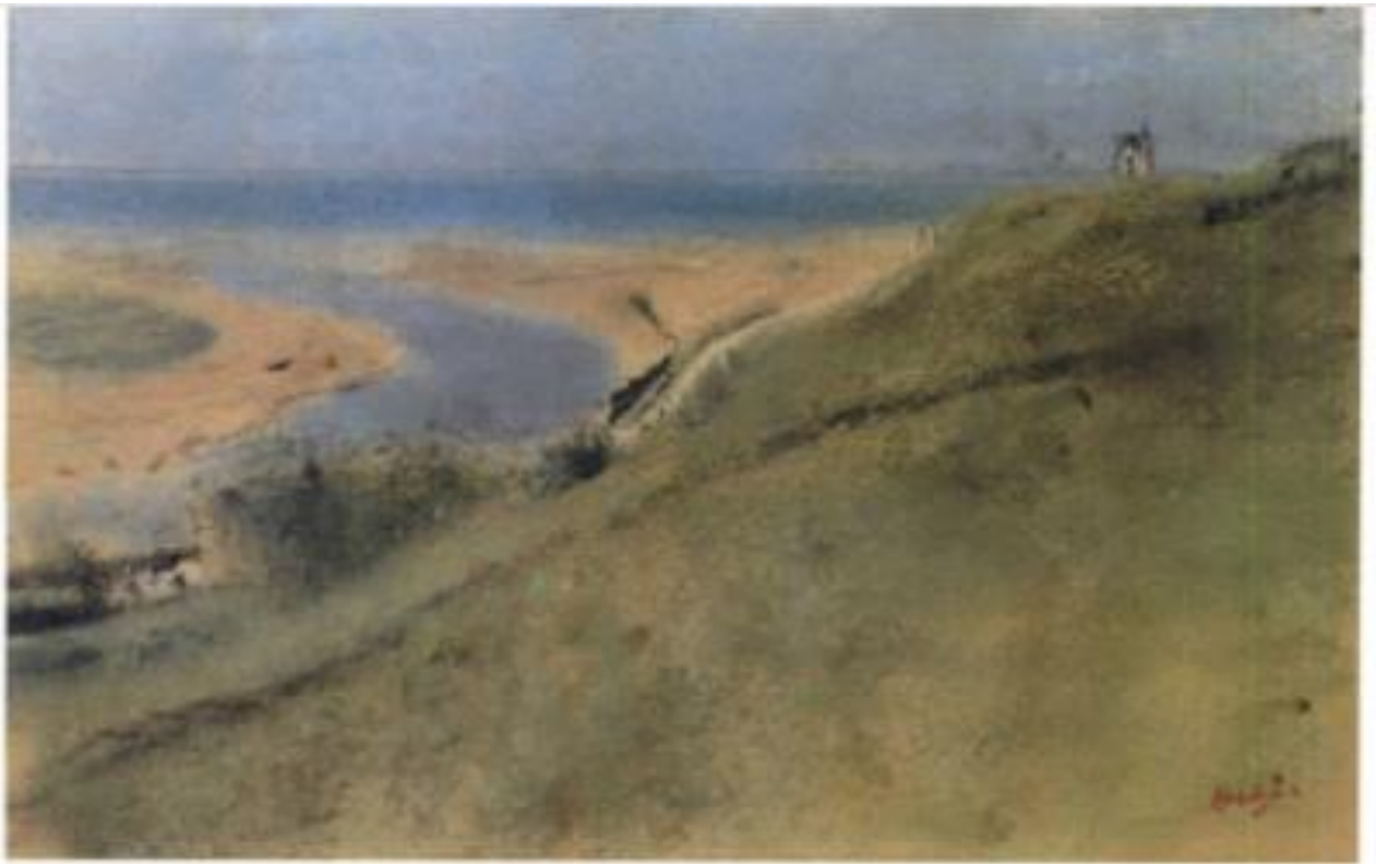
Falaise derrière la mer L 239 depuis le haut de la butte de Caumont