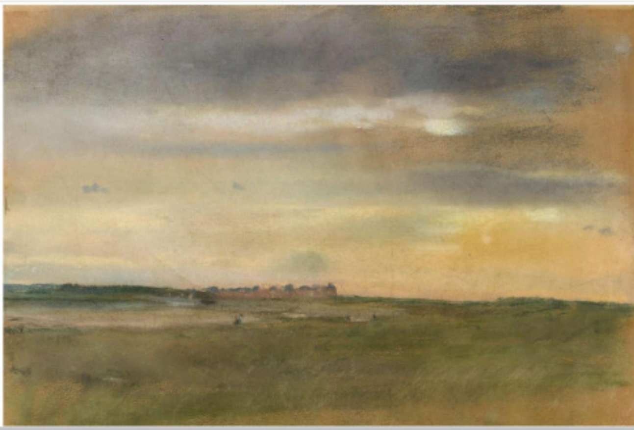
Coucher de soleil sur la côte collection privée