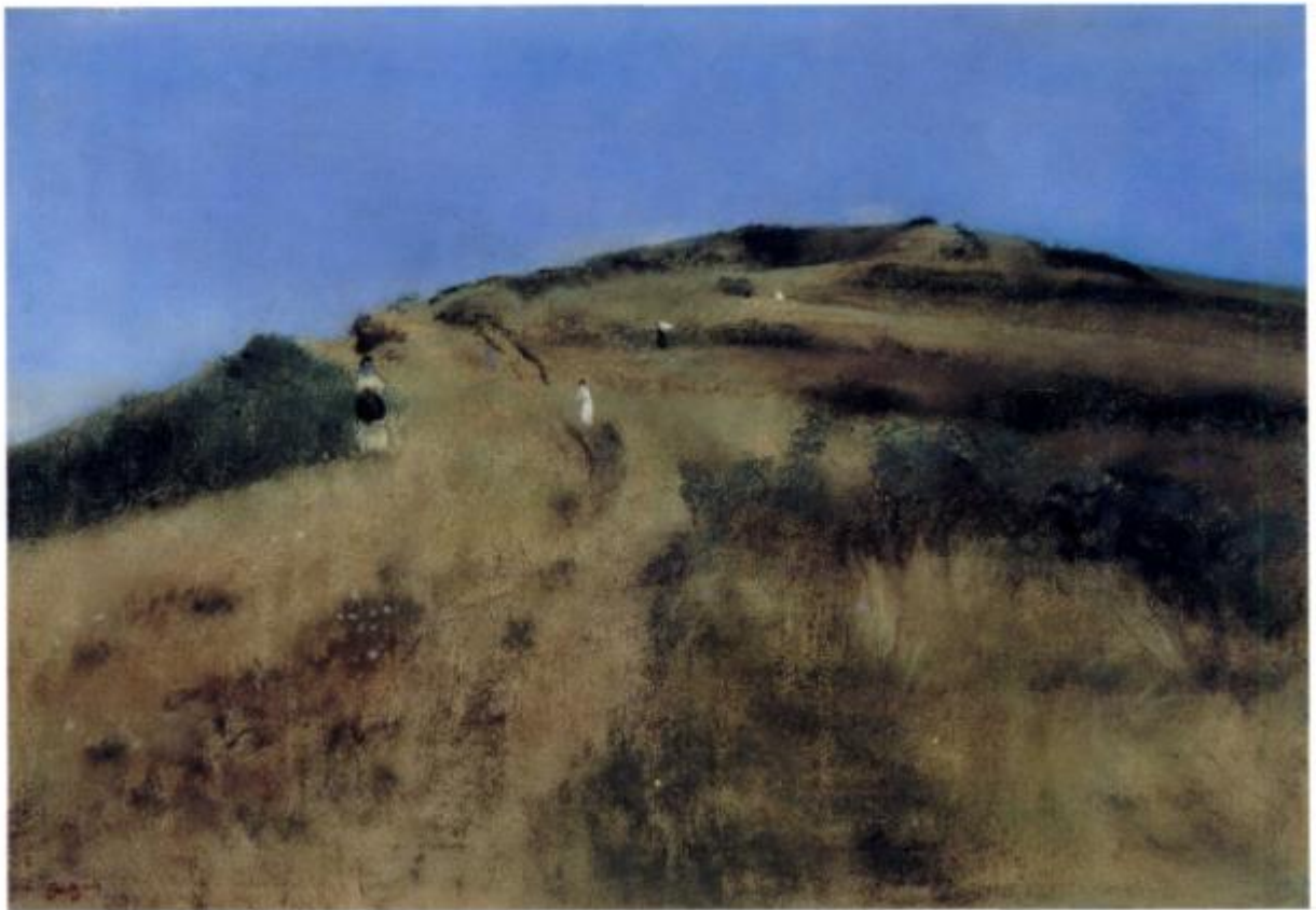
Sur la falaise- collection privée. L 232 depuis le haut des falaises vers Villers-sur-Mer